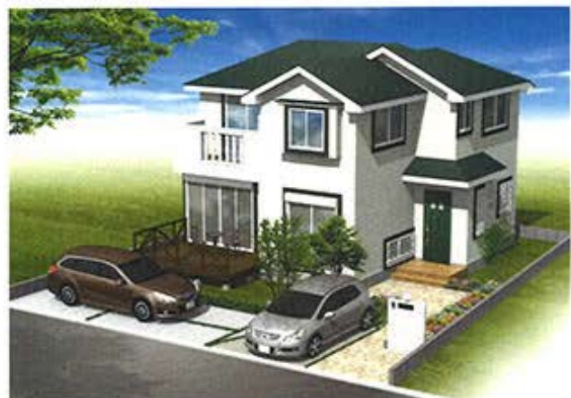
＜完成イメージパース＞

(税込) 建物価格 1,944万円 でお受け致します ※一部オプションは 含みません ◆キッチンなどの水廻り商品や内装、外壁などを一級建築士と相談しながら決められます。