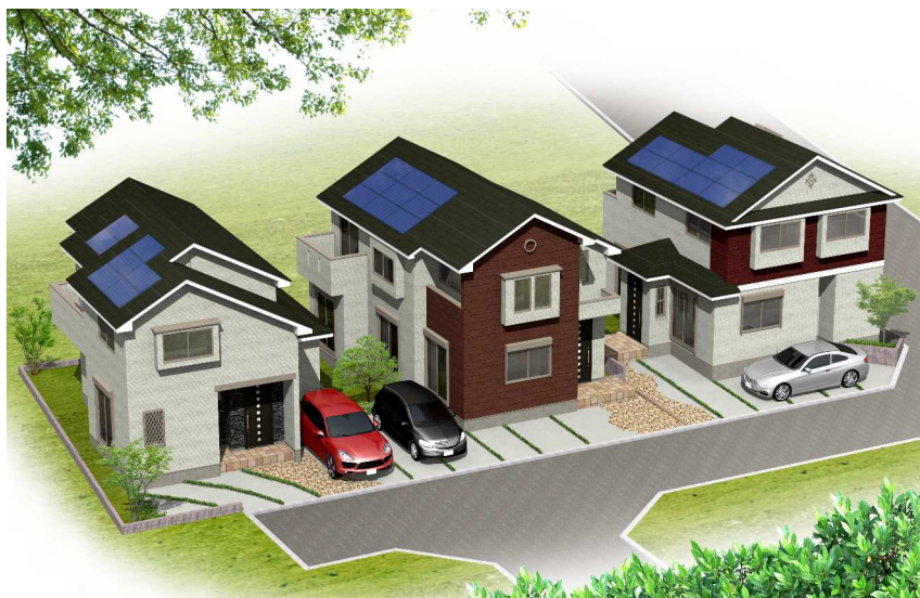
完成イメージパース(※実際とは一部異なります)